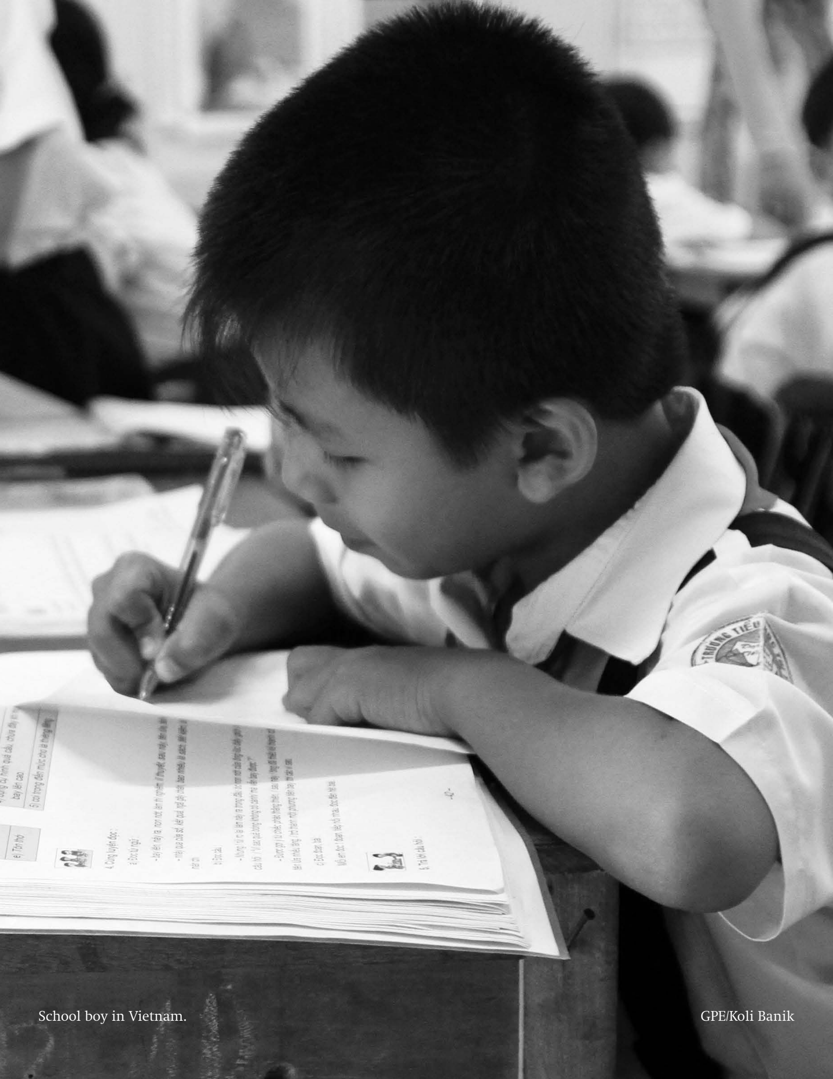
School boy in Vietnam.