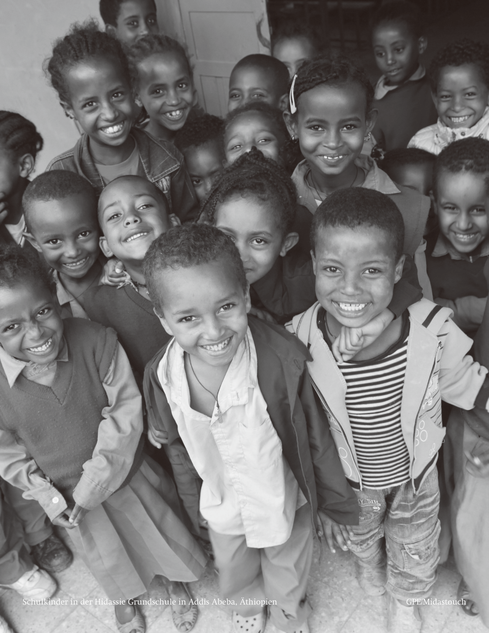
Schulkinder in der Hidassie Grundschule in Addis Abeba, Äthiopien