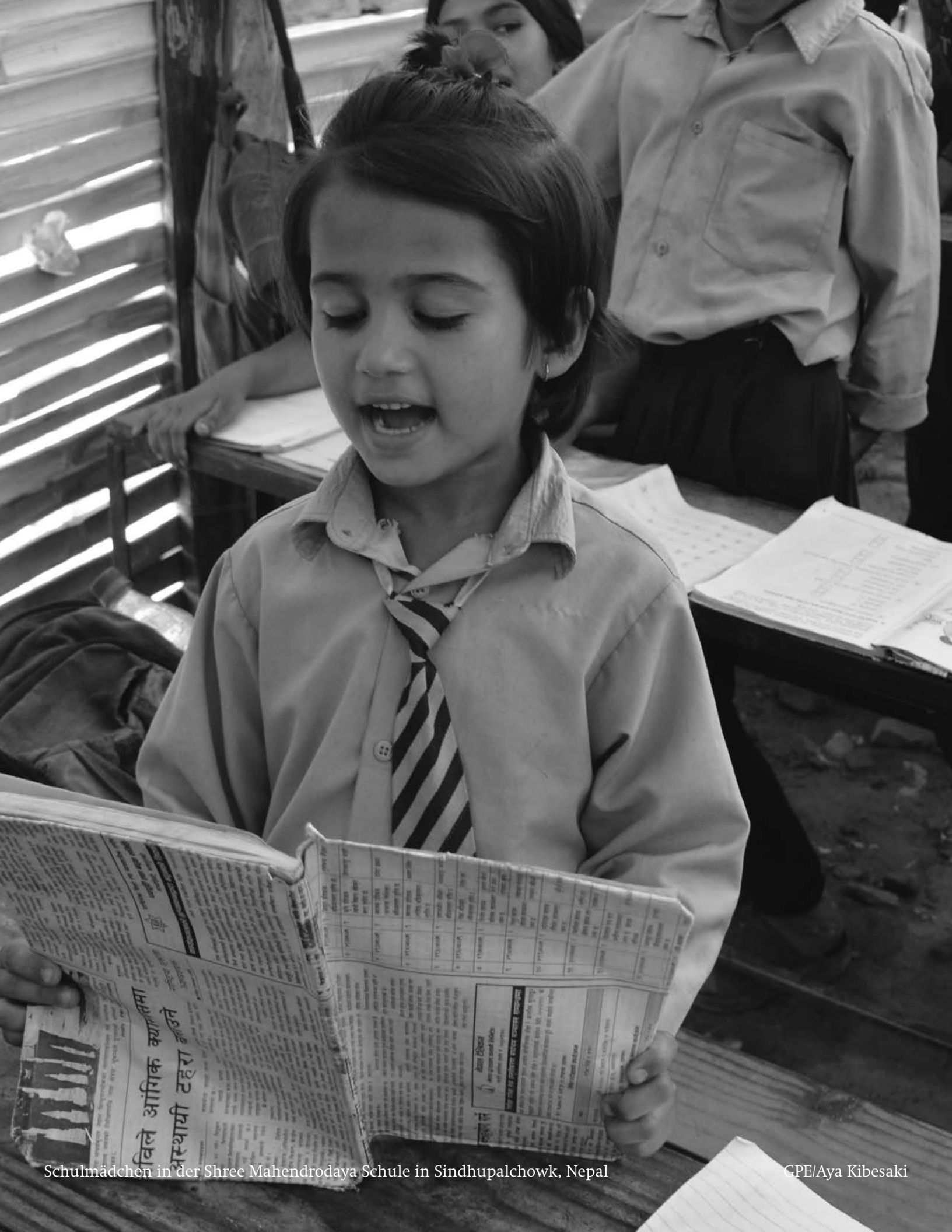
Schulmädchen in der Shree Mahendrodaya Schule in Sindhupalchowk, Nepal