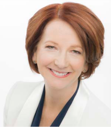
JULIA GILLARD Vorstandsvorsitzende