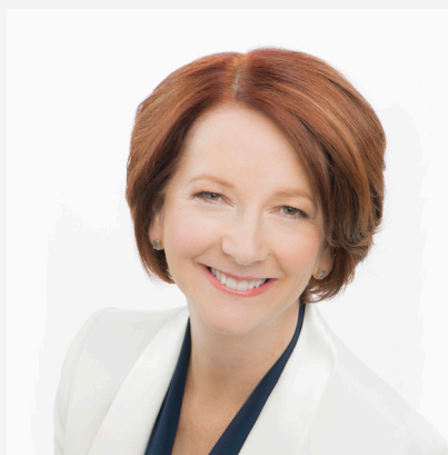
JULIA GILLARD Présidente du Conseil d'administration