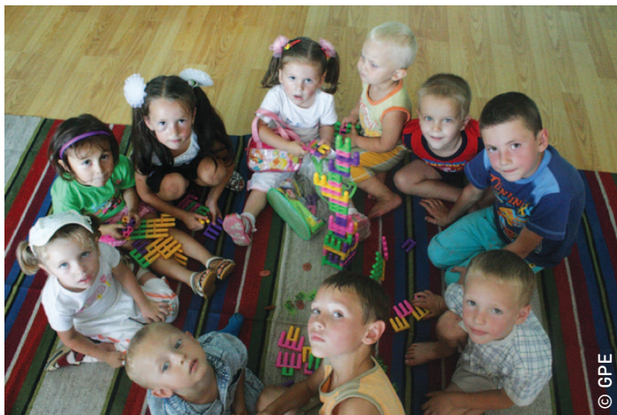
Des enfants construisent une tour avec des blocs dans leur salle de classe maternelle, située dans un centre de rééducation pour enfants handicapés.

Le Programme de développement de l'éducation de Zanzibar (ZEDP) pour la période 2008-2016 est le premier plan global qui définit des objectifs et des priorités spécifiquement pour l'EPPE. Le ZEDP a pour objectif d'assurer un accès équitable à un enseignement préscolaire et primaire de qualité pour tous les enfants, mais il vise également à ce que les enseignants soient formés pour répondre aux demandes du