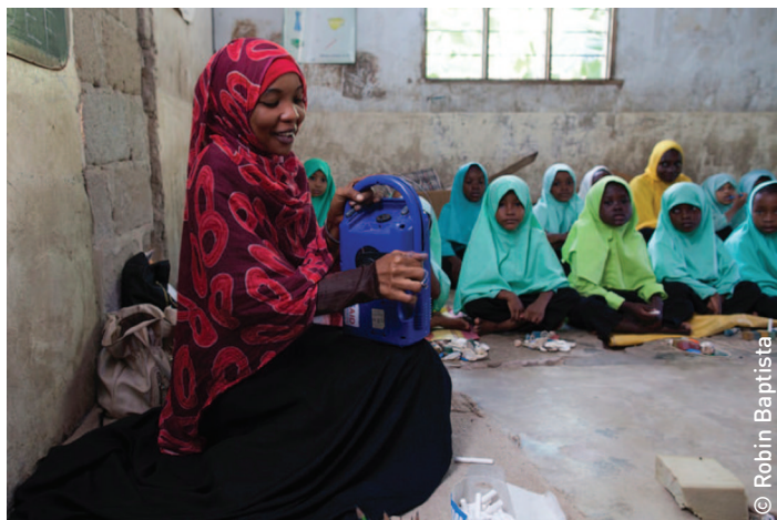
Les enseignants du cycle préscolaire se servent d'instructions interactives reçues par radio pour renforcer leur maîtrise du programme d'enseignement et pour enrichir l'environnement éducatif des enfants de zones mal desservies.

nouveau programme d'enseignement et pour disposer des qualifications professionnelles requises à tous les niveaux. Le ZEDP s'attache également à formuler et mettre en œuvre des politiques et des programmes, à renforcer les capacités institutionnelles pour réaliser des évaluations des besoins, et à suivre les conditions et les résultats.