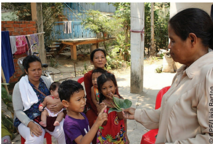
Dans une zone rurale située à près de quatre kilomètres de l'établissement préscolaire le plus proche, une « mère référente » utilise des feuilles d'arbre pour apprendre aux enfants à compter tandis que les autres mères observent la scène.

Les programmes éducatifs innovants à domicile reposent sur une « mère référente » bénévole qui fournit à un réseau de mères de sa communauté des informations relatives à l'impact sur les jeunes enfants des soins de santé, d'une alimentation adéquate et d'une stimulation précoce. Les femmes enceintes et les mères de nourrissons et de très jeunes enfants participent régulièrement aux sessions sur l'éducation et les mères référentes organisent des séances incluant également